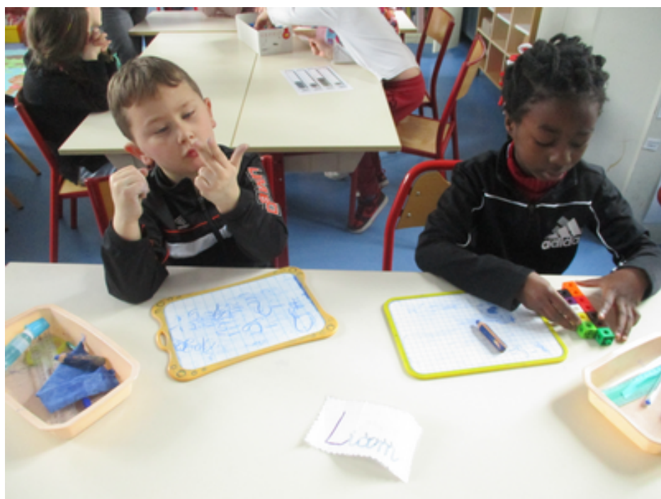
Nous avons réalisé la « carte mentale du 5 » (décompositions additives).