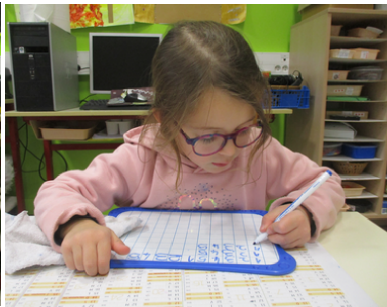
Nous avons fait une fiche sur le codage des syllabes et nous avons colorié celles qui contenaient le son [a] (Exploration de la langue orale).