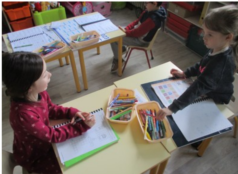
Nous avons fait des devinettes