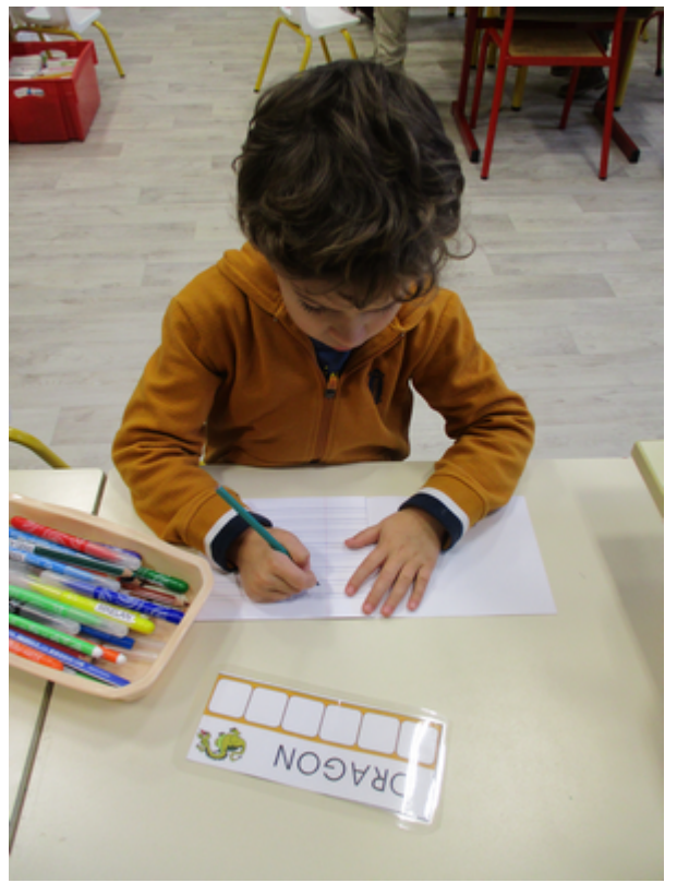
Nous avons poursuivi nos cahiers d'autonomie (activités graphiques).