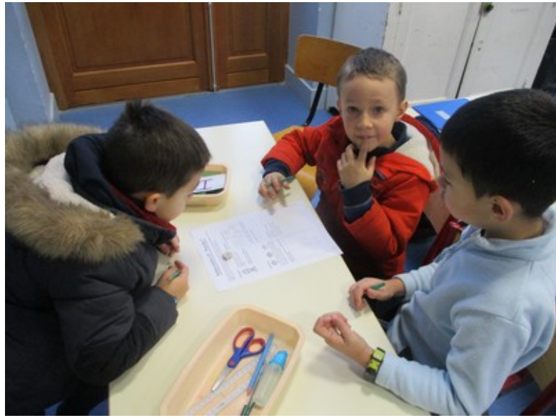
tableau de numération dizaines/unités), fait des fiches de calcul rapide et poursuivi notre mini-fichier « billard ».