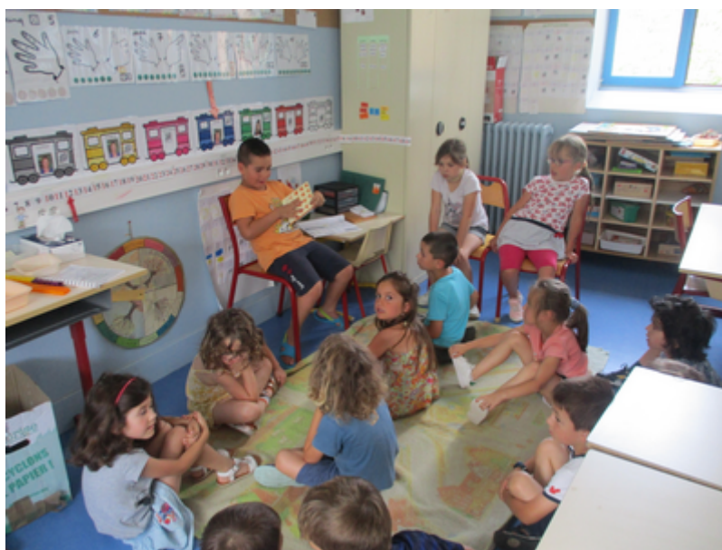
En Sciences, nous avons fait une évaluation sur le squelette et les articulations.